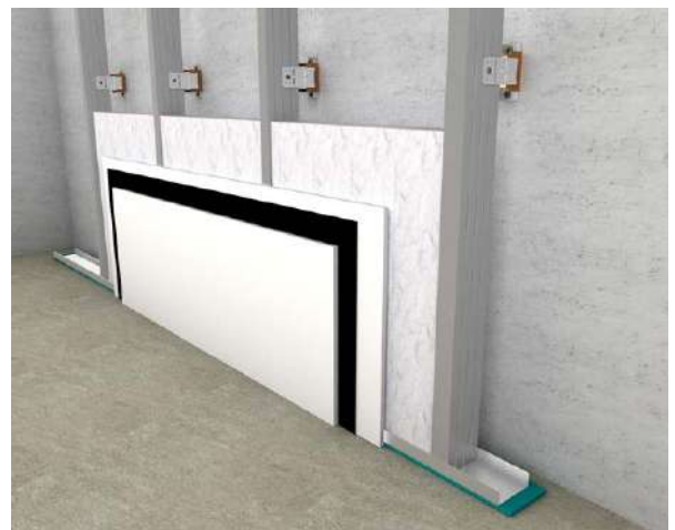
Εφαρμογή iZiFon σε τοιχοποιία ξηράς δόμησης

Η εταιρία μας εφαρμόζει Σύστημα Διαχείρισης Ποιότητας ISO 9001.2008 & Σύστημα Περιβαλλοντικής Διαχείρισης ISO 14001.2004