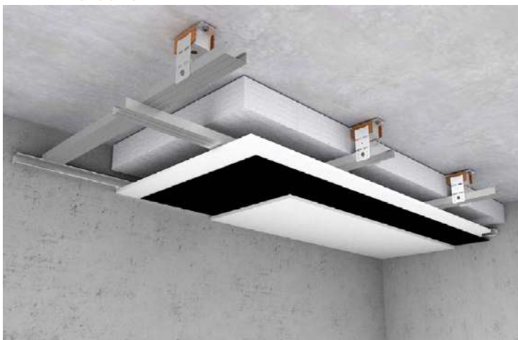
Εφαρμογή iZiFon σε πλωτή οροφή