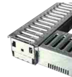
ND FR81 Drainagegoot