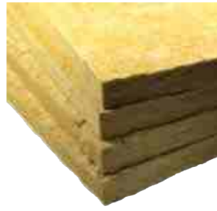
ND WSM50, ND SM25/SM50