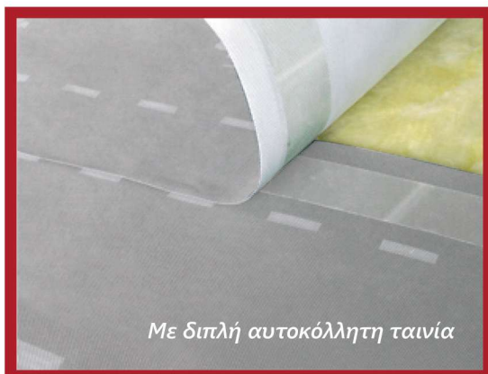
Με διπλή αυτοκόλλητη ταινία