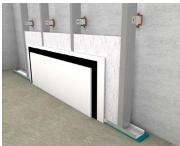
Εφαρμογή iZiFon σε τοιχοποιία ξηράς δόμησης

Η εταιρία μας εφαρμόζει Σύστημα Διαχείρισης Ποιότητας ISO 9001.2008 & Σύστημα Περιβαλλοντικής Διαχείρισης ISO 14001.2004