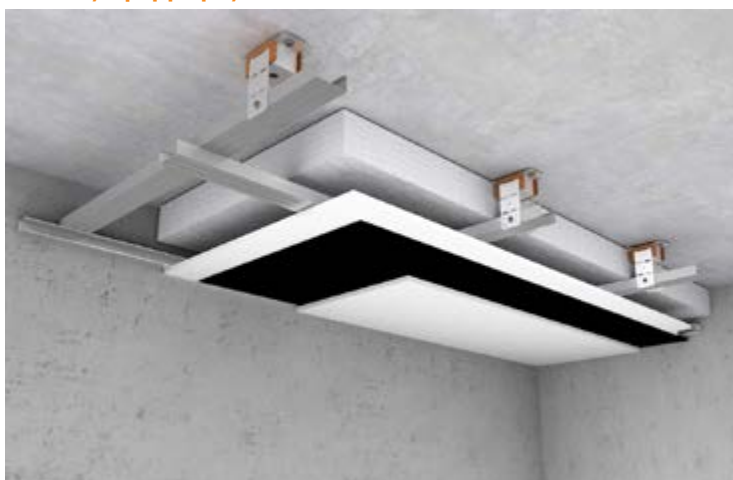
Εφαρμογή iZiFon σε πλωτή οροφή